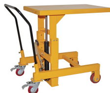
Table élévatrice pour la manutention de charges à différentes hauteurs, améliorant l'ergonomie et la sécurité.